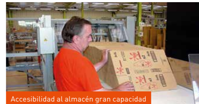
Accesibilidad al almacén gran capacidad