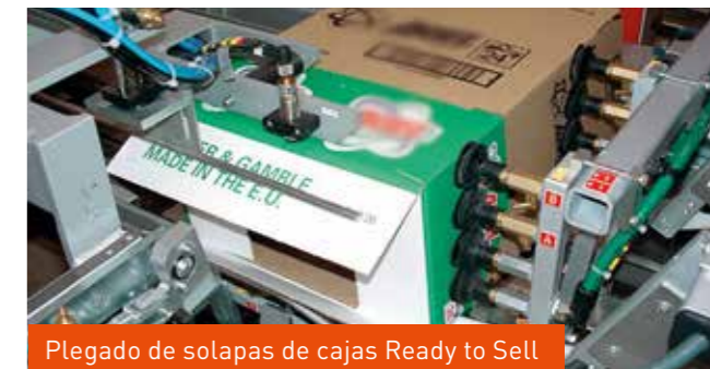
Plegado de solapas de cajas Ready to Sell