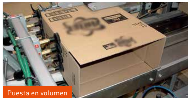
Puesta en volumen