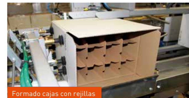
Formado cajas con rejillas