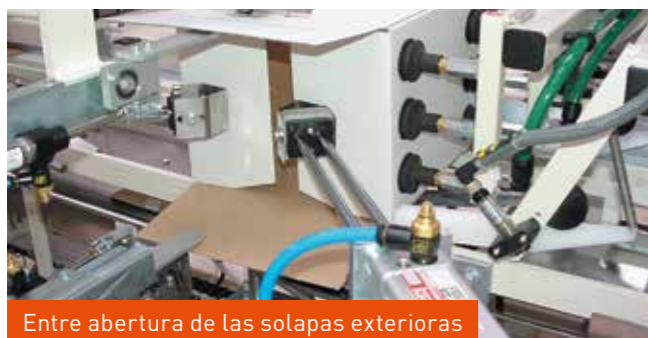
Entre apertura de las solapas exteriores